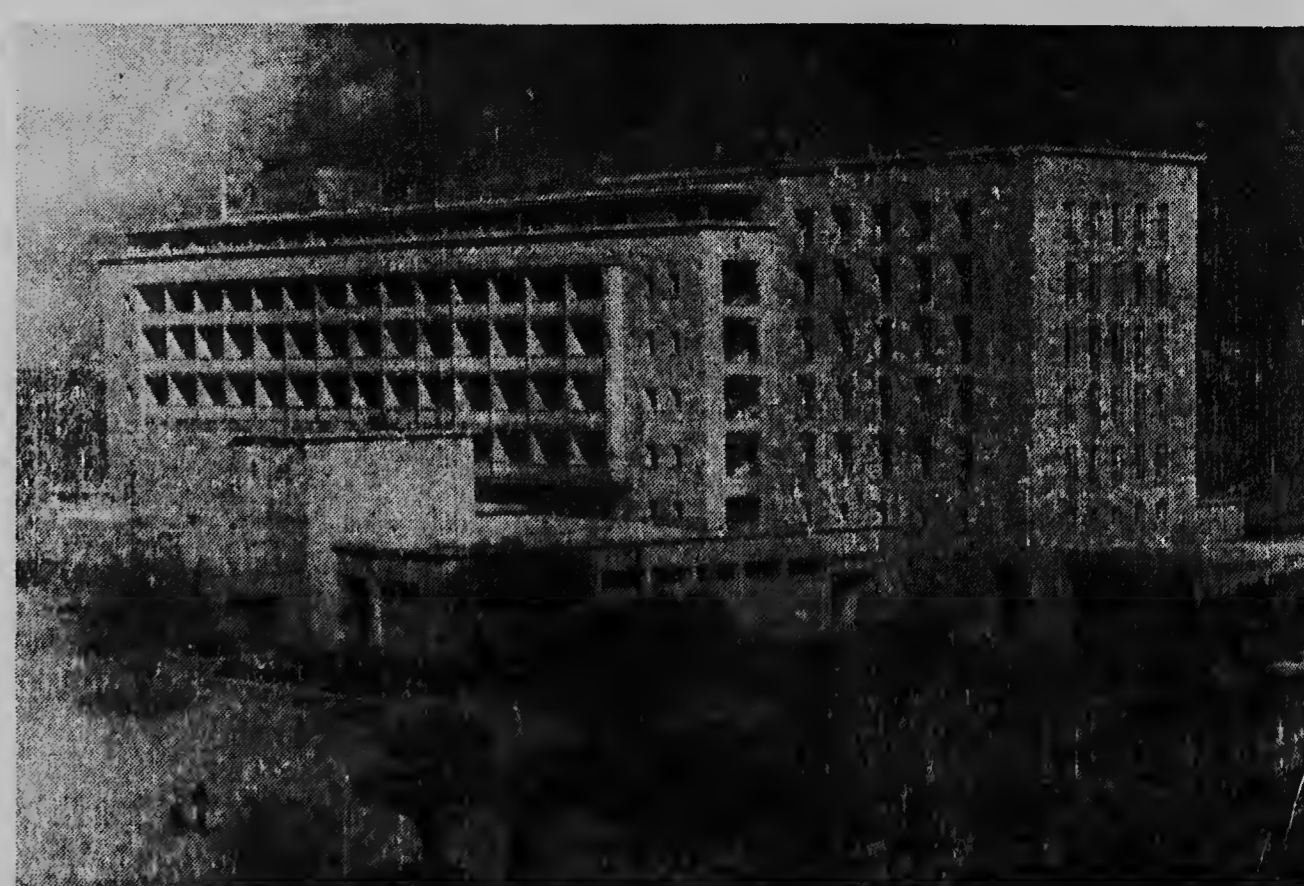
Aqui nos ta mira e bella i pintoresco „SheratonTel-Aviv“, cu ta un dje hotelnan di mas bunita mas mahestuoso, mas moderno i lujoso na Israel, cu bao di gran interes publico a ser inaugurad oficialmente. E bodedanan dje hotel aqui ta construi di piedranan blancu especial i masha bunita cualnan a ser cobi for den cerrunan den cercania di Nazareth. Esaki ta un palacio cu induda blemento hopi soberanonan lo ta invidia pa su buniteza i o centro bon esochi.

DIJAKARTA, 27 april. — Segun oficina di prensa Jugoslavo Tanjug participa di a hanja un informacion ministerio Indones di relacões exteri res, cu pronto mas o men 500 Indones lo repatria for di Surinam pa Indonesia.